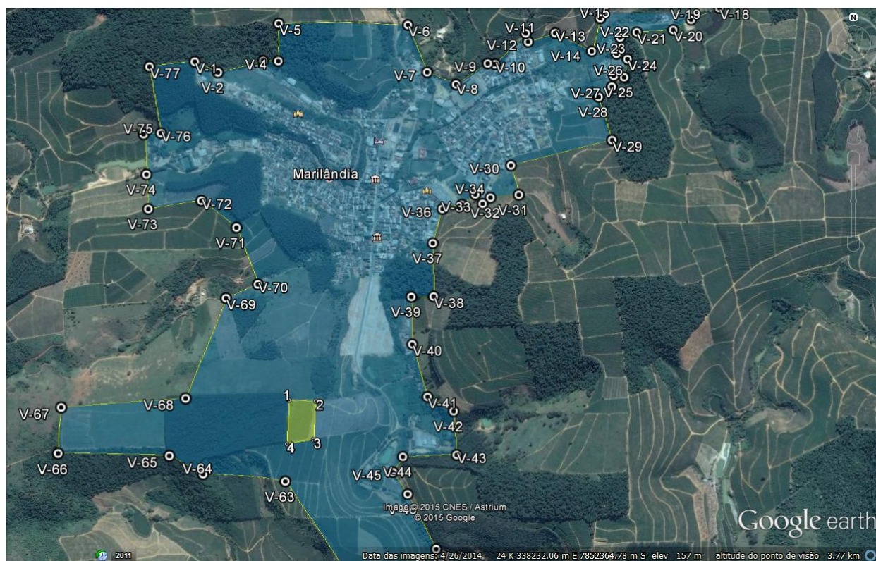
Planta de localização do loteamento dentro do perímetro urbano da Sede